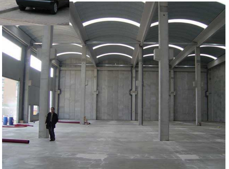
8 viviendas en L'Hospitalet de Llobregat