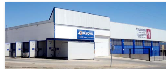
Obra nueva. Nave industrial y Centro de Lavado. Campo de Criptana.