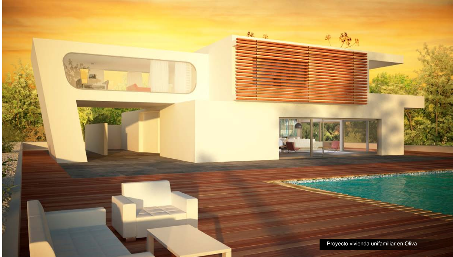
Proyecto vivienda unifamiliar en Oliva

De izquierda a derecha: Zona de baño Vinoteca-Spa. Reforma Pizzería Milano, Planta Alta. Proyecto de vinoteca-spa en Ciudad Real .