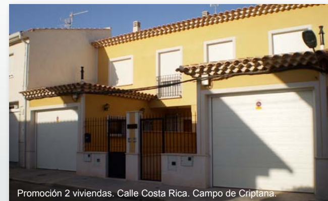
Promoción 2 viviendas. Calle Costa Rica. Campo de Criptana.