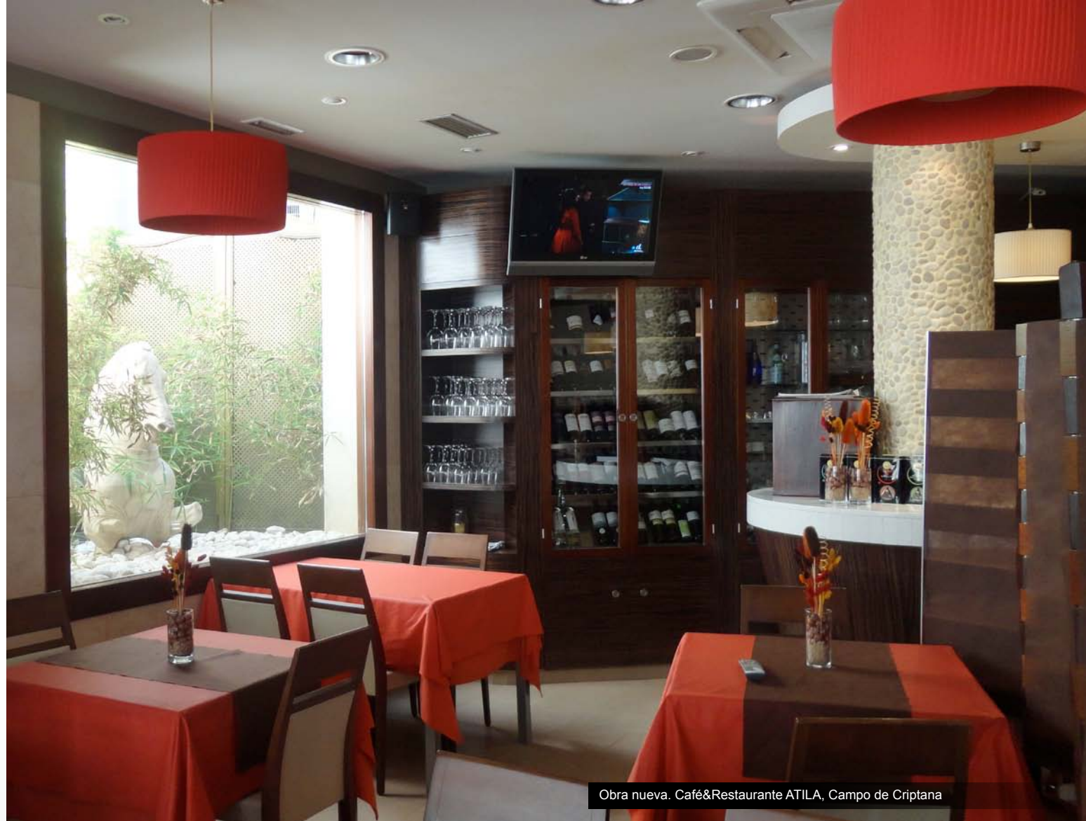
Obra nueva. Café&Restaurante ATILA, Campo de Criptana

Nuestra estrategia de empresa se basa en la satisfacción final del cliente como máximo activo, combinando la eficiencia de sus recursos, la cuidadosa elección de empresas que intervienen en la obra y la excelencia en su actividad diaria a través de la mejora continua.