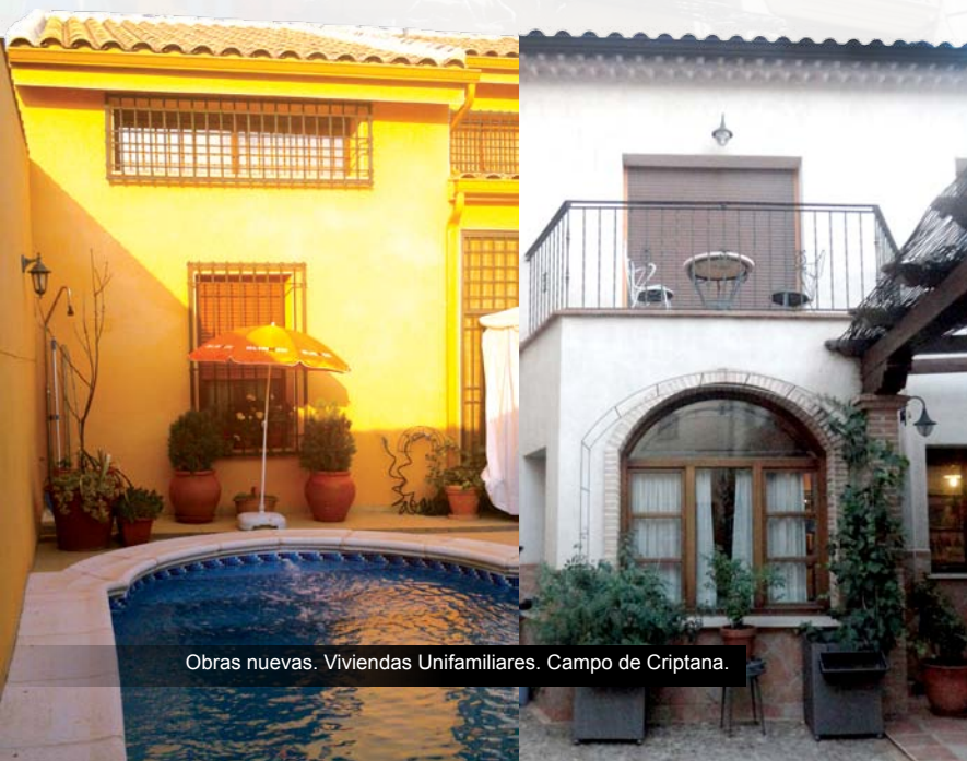
Obras nuevas. Viviendas Unifamiliares. Campo de Criptana.