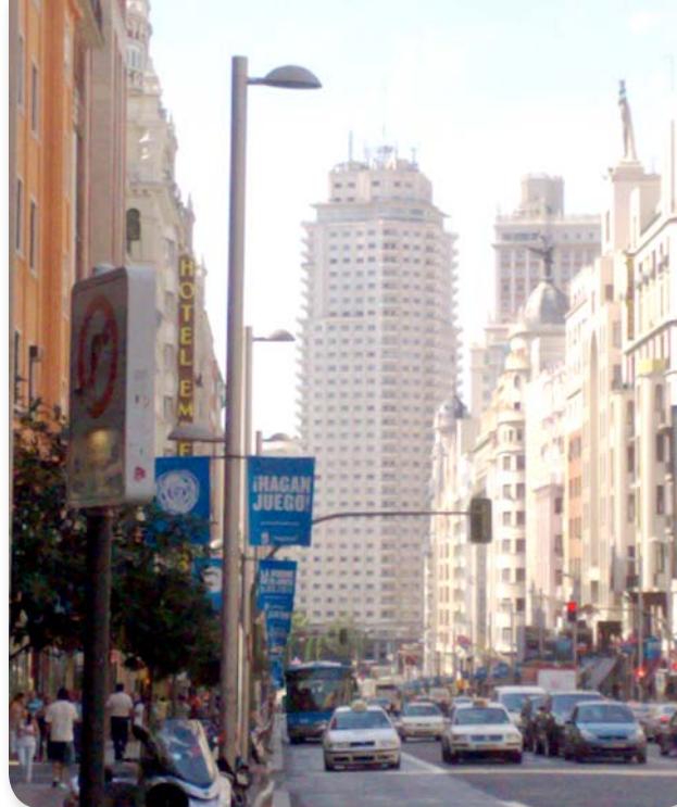
Reforma de 133 viviendas en Torre Madrid. Plaza de España. Madrid.