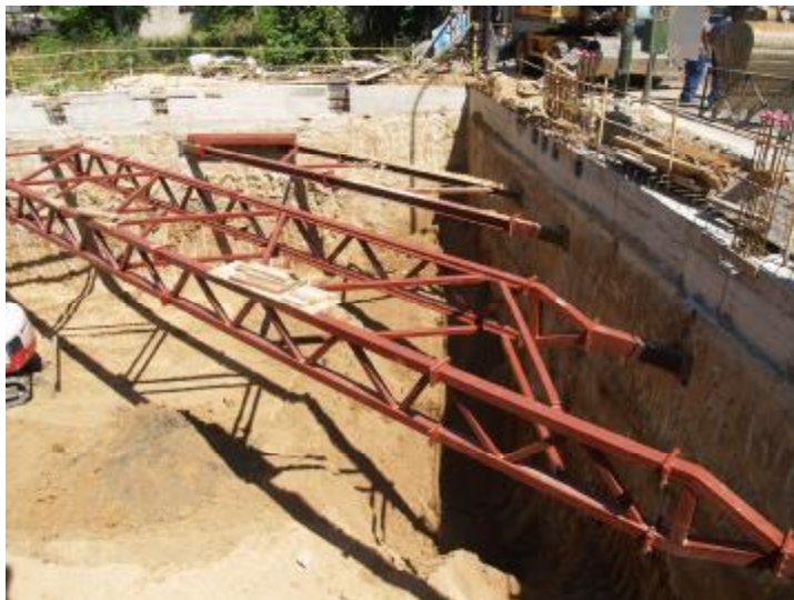
EDIFICIO DE VIVIENDAS CON 4 SÓTANOS DE GARAJES