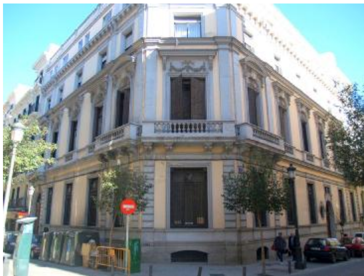
REHABILITACIÓN CASA CONVENTO ESCLAVAS DEL SAGRADO CORAZÓN DE JESÚS.